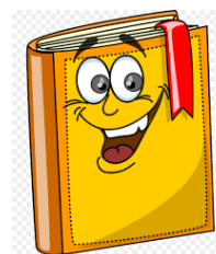
TABELA PARA OS ALUNOS DO NÍVEL III.